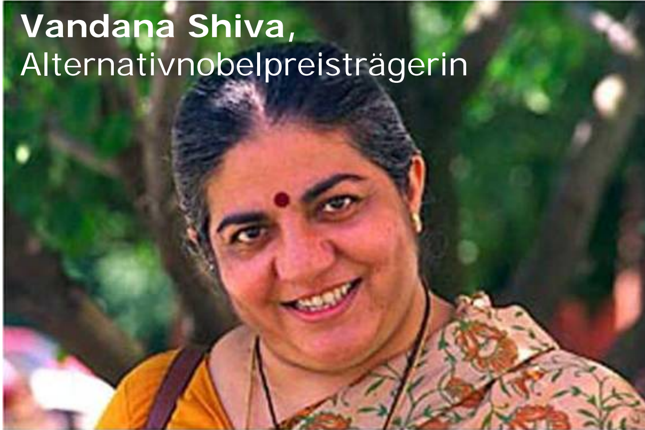
Vandana Shiva, Alternativnobelpreisträgerin